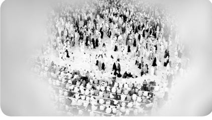
Mekke ve Medine'nin Fazileti Abdullah Demirciođlu / 3