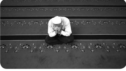
Doğru Söylediyse Kurtuldu Abdullah Demircioğlu / 3